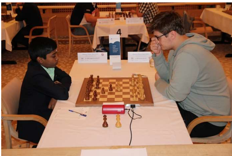
Foto: fra den spændende afslutning af 2019 udgaven af Xtracon Chess Open. Et typisk set-up med DGT e-board.

Mange danske klubber er velforsynede med ure.